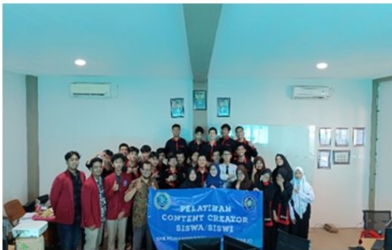
Figure 3. Photo Bersama Siswa/Siswi dan Pihak Pengajar

Gambar berikut adalah penutupan kegiatan pelatihan content creator didampingi oleh pengajar dan beberapa mahasiswa Universitas Muhammadiyah Sidoarjo