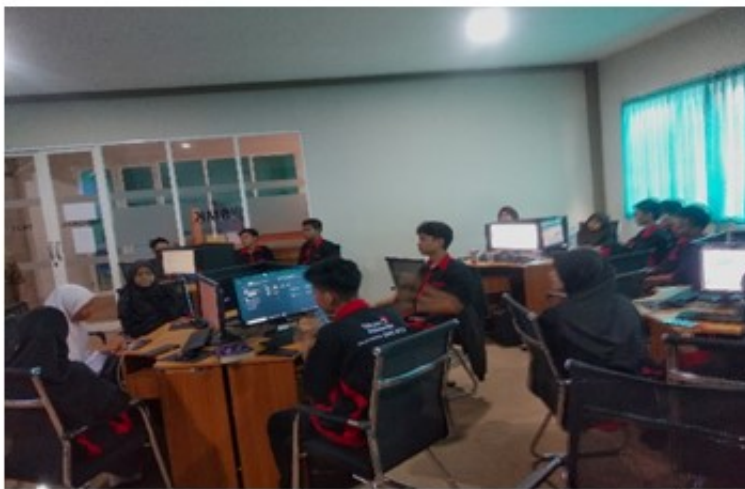
Figure 2. Gambar (Atas). Kegiatan Pelatihan Content Creator, Gambar (Bawah). Kegiatan Pelatihan Content Creator

Gambar berikut adalah penutupan kegiatan pelatihan content creator didampingi oleh pengajar dan beberapa mahasiswa Universitas Muhammadiyah Sidoarjo