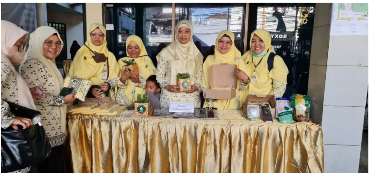
Figure 2. Pameran Produk Usaha yang Dikelola Pimpinan Daerah Nasyiatul Aisyiyah Sulawesi Selatan