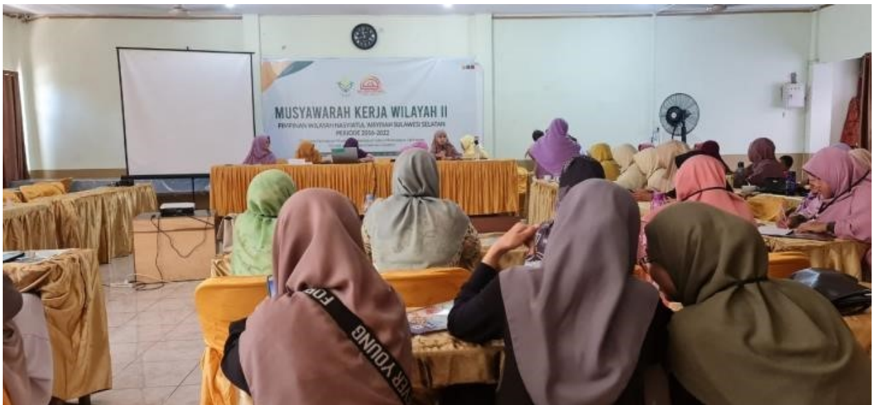
Figure 1. Musker dan Konsolidasi Pimpinan Daerah

Kegiatan yang dikelola dan dijalankan oleh Pimpinan Daerah Nasyiatul Aisyiyah Sulawesi Selatan sangat beragam dan mengharuskan pengelolaan anggaran yang tepat dalam mengatur dan merumuskan strategi organisasi. Sementara itu, pengurus Pimpinan Daerah Nasyiatul Aisyiyah Sulawesi Selatan yang sebagian besar adalah ibu rumah tangga belum memahami dengan baik metode pencatatan administrasi keuangan yang baik sehingga masih menggunakan metode pencatatan keuangan secara manual.