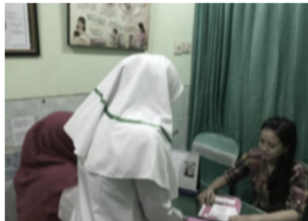
Figure 1.