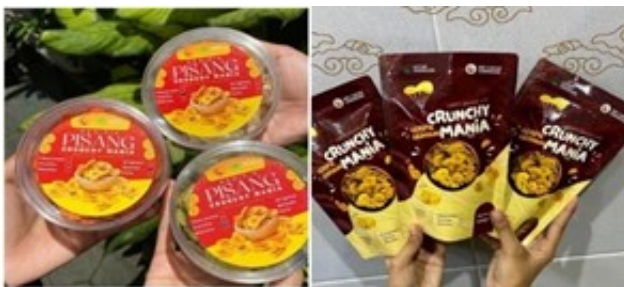
Figure 6. Produk Jadi UMKM Crunchy mani

Dari hasil yang di dapatkan setelah melakukan proses seperti yang dilakukan di pembahasan diatas menjadikan produk bisa berkualitas. Produk yang berkualitas akan membuat konsumen/pelanggan merasa puas dengan hasil produk yang ditawarkan perusahaan. Selain itu, setiap perusahaan didirikan dengan maksud untuk mencapai tujuan yang telah ditetapkan yaitu memperoleh laba yang maksimal sehingga dapat mempertahankan dan menjaga kelangsungan usaha itu sendiri. [7]Barang jadi adalah produk akhir yang siap untuk diperjualkan di pasar. Jenis persediaan ini sudah melewati semua tahap produksi dan pengecekan [8][15]. Upaya dengan dilakukannya ada produk UMKM ini bisa menjadikan pertumbuhan perekonomian di ranting Aisyiyah