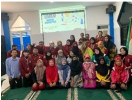
Figure 2. Penyuluhan

Penyuluhan merupakan salah satu bentuk penyebaran informasi, sebagai proses belajar sehingga dapat menjadi agen perubahan dalam proses perubahan social [5]. Melalui penyuluhan, diharapkan dapat membentuk sikap dan perilaku yang lebih baik dalam bermasyarakat. Pada kegiatan ini mengadakan sosialisasi tentang produk UMKM keripik pisang. Yang dimana kita bersama ibu-ibu Aisyiyah Candinegoro melakukan kegiatan sosialisasi tentang bagaimana cara memasarkan produk dengan mudah dan efisien, mengola produk kripik pisang dengan baik dan benar, serta pengenalan aplikasi untuk penjualan produk.[10]