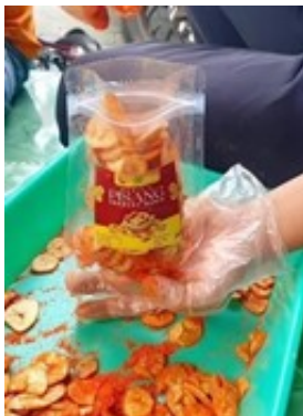
Figure 5. Packaging

Packaging yaitu sebuah kegiatan Pekerjaan ini meliputi mengemas produk, menentukan desain, membuat paket, dan membungkus produk. Kemasan kini berkembang fungsinya dari yang awalnya hanya sekedar melindungi produk menjadi fungsi identitas merek, sehingga kemasan yang tertata dengan baik dapat digunakan sebagai alat komunikasi atau periklanan untuk membantu meningkatkan penjualan [3]. Dengan penggunaan packaging, diharapkan dapat tercipta produk pangan lokal yang lebih berkualitas dan aman bagi konsumen. [14]. Proses pengemasan dalam produk UMKM kripik pisang ini di bagi dalam beberapa kemasan yaitu berupa kemasn toples yang berukuran 120gr, kemasan ziplock design, dan kemasan ziplock transparan.