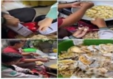
Figure 4. Proses Produksi

produksi keripik pisang crunchy mania yaitu antara lain, pengupasan, penyerutan, penggorengan, diberi varian-varian rasa, dan pengemasan dengan rapi.[13]