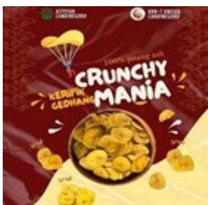
Figure 3. Desain Produk UMKM

Pada kegiatan ini berhasil membuat sebuah logo yang menarik untuk produk UMKM kripik pisang crunchy mania dengan warna merah dan krem, dan diberi gambar produk kripik pisang dengan tujuan agar pembeli tertarik untuk membeli sehingga dapat terjual banyak di pasaran.[12]