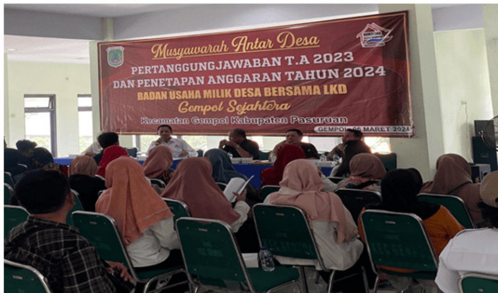
Figure 1. Musyawarah Antar Desa (MAD)

Secara keseluruhan, hasil wawancara dari manager tata usaha, manager keuangan dan ketua kelompok usaha diatas menunjukkan bahwa komunikasi yang baik dan terstruktur tidak hanya meningkatkan efektivitas program tetapi juga membangun kepercayaan dan keterlibatan aktif dari anggota kelompok usaha perempuan dalam program pembiayaan keuangan mikro yang dikelola oleh BUMDESMA "Gempol Sejahtera". Berikut merupakan salah satu contoh undangan sosialisasi pemahaman terhadap kelompok usaha perempuan tentang Angsuran Dana Bergulir Masyarakat di BUMDesa Bersama "Gempol Sejahtera" Kecamatan Gempol, sebagai berikut :