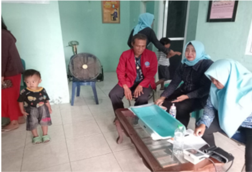
Figure 2. Kegiatan Posyandu

Sebagai pendukung hasil wawancara yang disampaikan informan diatas bahwa posyandu Desa Durungbanjar pada keaktifan kader posyandu menangani stunting dengan melakukan kegiatan posyandu sesuai dengan jadwal secara rutin. penulis melampirkan gambar sabagai berikut: