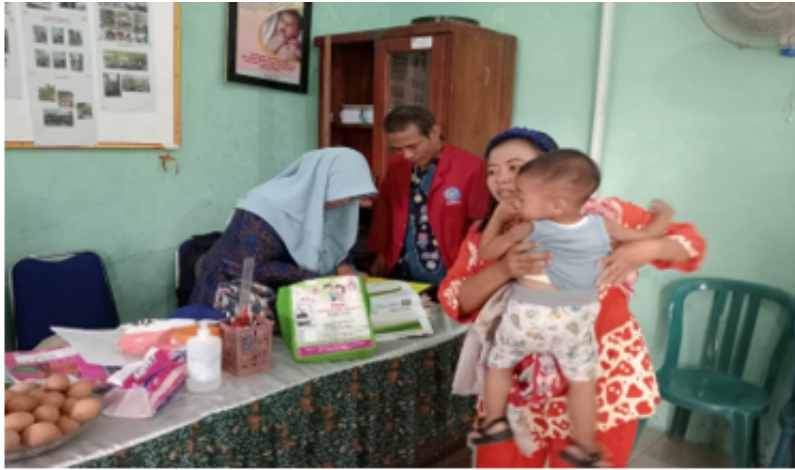
Figure 3. Program Posyandu

Waktu Pelaksanaan Posyandu. Waktu pelaksanaan posyandu di Desa Durungbanjar Kecamatan Candi Kabupaten Sidoarjo yaitu 1 kali dalam sebulan, biasanya dilakukan pada tanggal 11 mulai dari jam 08.30 sampai dengan selesai. Mekanisme yang dilakukan oleh posyandu dengan melakukan pengecekan status gizi anak apakah anak tersebut normal atau stunting , pemenuhan kebutuhan nutrisi, selain itu penyelenggara posyandu dan kader posyandu memberikan arahan untuk ibu balita dan ibu hamil untuk mencukupi nutrisi yang dibutuhkan agar tidak terjadinya stunting . Adapun kegiatan dari Posyandu ini cukup beragam (imunisasi, penimbangan balita, PMT, pemeriksaan kesehatan, pemeriksaan tensi, konsultasi KB). Kegiatan Posyandu dilakukan rutin tiap bulan setiap minggu keempat. Gambaran Keberhasilan Pelaksanaan Posyandu Menangani Stunting . Hal tersebut disampaikan oleh Ketua kader Posyandu sebagai berikut: