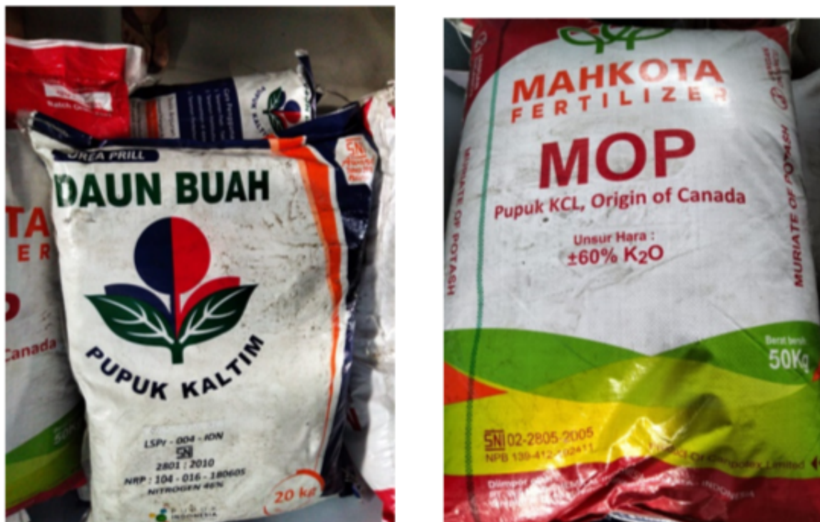
Figure 1. Pupuk kaltim dan mahkota digunakan sebagai bahan pupuk bibit pisang

Gambar diatas merupakan pupuk kaltim dan pupuk mahkota yang biasanya digunakan untuk pemupukan dan penguatan tanaman bibit pisang di desa krembung kecamatan krembung kabupaten sidoarjo. Selain pemupukan proses penanaman bibit pisang ini di berikan perawatan yang baik dan benar untuk menjaga stabilitas dan meningkatnya hasil panen pisang di desa krembung. Dimana proses pemupukan menggunakan pupuk premium ini mampu memberikan hasil panen yang melimpah ruah dan berkualitas tinggi. Serta akan berdampak pada perekonomian desa krembung kecamatan krembung kabupaten sidoarjo itu sendiri.