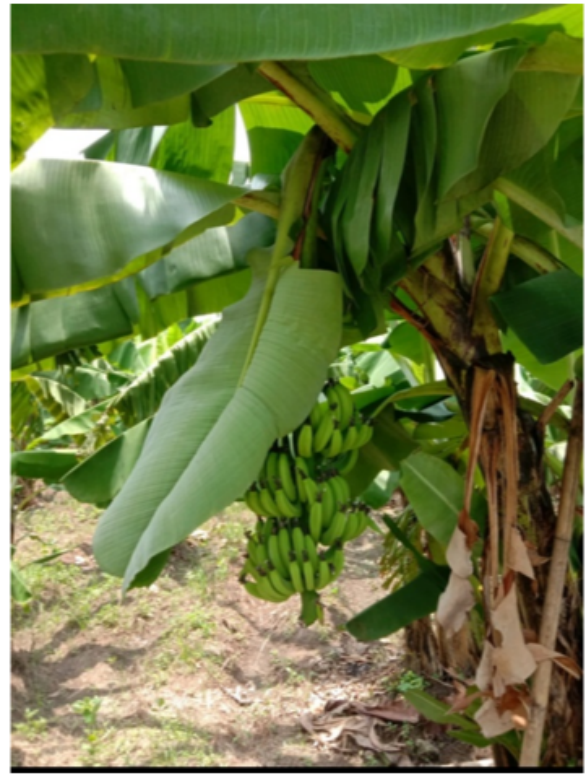
Figure 3. Bibit Benih Pisang

Berdasarkan data pada gambar diatas menjelaskan bahwa BUMDes Desa Krembung beserta Masyarakat Desa Krembung memutuskan untuk melakukan penyelarasan kepada adanya program menanam yang telah di lakukan. BUMDes Desa Krembung dan M asyarakat Desa Krembung melakukan penyelarasan terkait penanaman, bahwa tanaman yang dipilih untuk di realisasikan pada program menanam yakni bibit pohon pisang. Meskipun jenis pisang yang dipilih bervariasi akan tetapi harus tetap berupa bibit buah pisang. Adanya penyelarasan ini diyakini dapat mengoptimalkan hasil terhadap perekonomian dan kesejahteraan masyarakat desa krembung serta mampu diyakini membawa kepada desa krembung yang memiliki ekonomi yang stabil. Dengan adanya BUMDES diyakini dapat mengelola hasil alam dengan baik [17], [18].